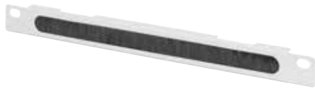
4016032139843 / DN-10 ORG-1/2U 0,5HE Kabelbürstenleiste 0.5U cable brush management panel 22x254x12 mm, Farbe Grau (RAL 7035) 22x254x12 mm, color grey (RAL 7035)