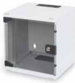
4016032331421 / DN-10-05U-1 6HE Wandgehäuse 6U wall mounting cabinet 330x312x300 mm, Farbe Grau (RAL 7035) 330x312x300 mm, color grey (RAL 7035)