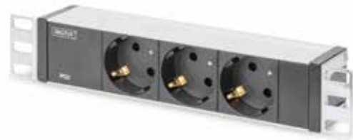
4016032280712 / DN-95411 1HE Aluminium Steckdosenleiste 1U Aluminum PDU Nennleistung: 4000W, 250VAC 50/60Hz Rated power: 16A, 4000W, 250VAC 50/60Hz 3x Schutzkontakt 3x safety outlet