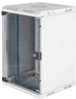
4016032462811 / DN-1019 10HE horizontal (10"), 5HE vertikal (19") Kombi-Wandgehäuse 10U horizontal (10"), 5U vertical (19") combi wall mount. cab. 550x350x350 mm, Farbe Grau (RAL 7035) 550x350x350 mm, color grey (RAL 7035)

... UND 482,6 MM (19") KOMBI ... AND 482.6 MM (19") COMBI