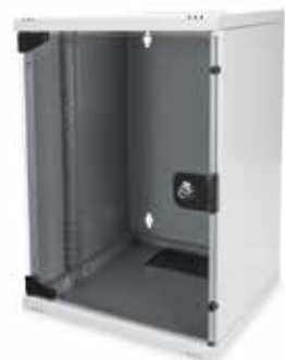
4016032445647 / DN-10-09U 9HE Wandgehäuse 9U wall mounting cabinet 464x312x300 mm, Farbe Grau (RAL 7035) 464x312x300 mm, color grey (RAL 7035)